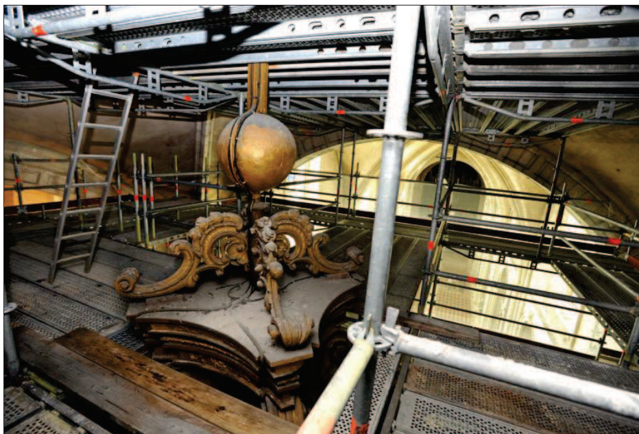
■ Une vue imprenable du haut du baldaquin !

L'œuvre est en fait la réplique, en miniature, du célèbre baldaquin de la cathédrale Saint-Pierre de Rome. Il n'est pas l'œuvre du Bernin, mais du chanoine de