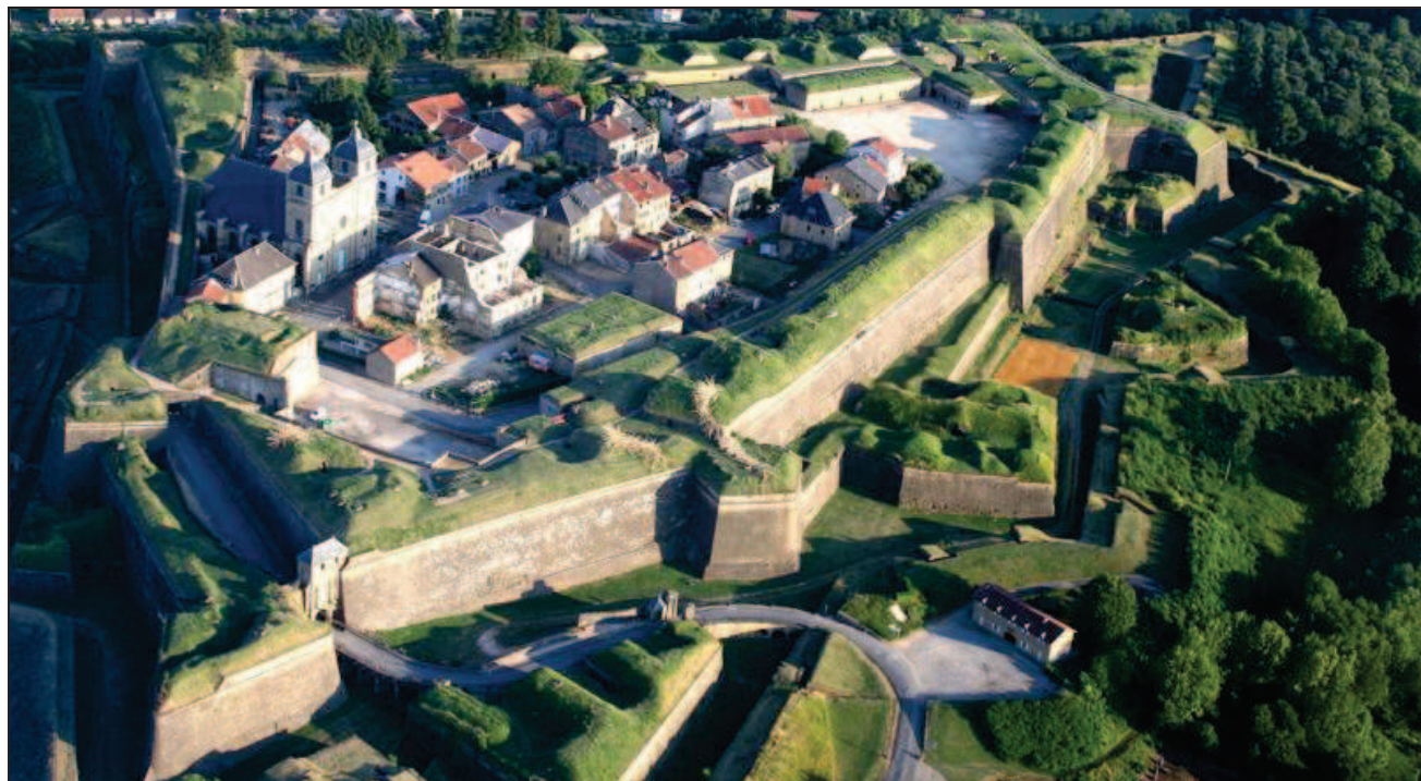
■ La citadelle de Montmédy : un haut lieu historique, touristique et artistique.

Passé aux mains de Charles Quint par le jeu des alliances et des mariages, Montmédy voit son château détruit au profit d'une enceinte fortifiée : la citadelle naît au 16 e siècle (un comble : pour se protéger des Français !) Une histoire riche et mouvementée que l'on peut découvrir tout au long de la promenade qui parfois nous