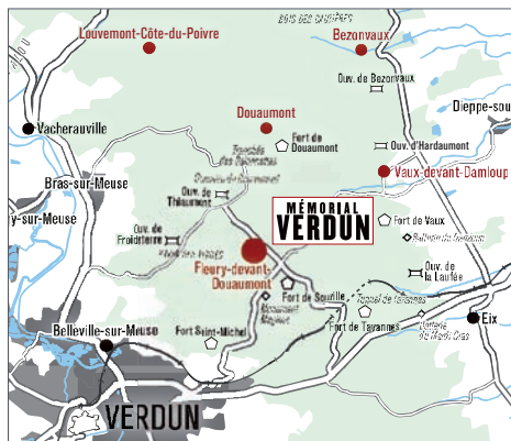
Carte du champ de bataille