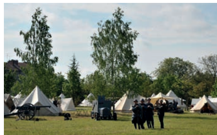
Centenaire Verdun, 2016